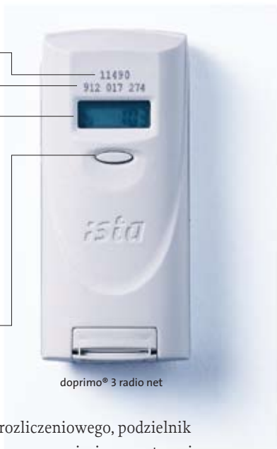
doprino® 3 radio net

Przycisk odczytowy 1x naciśnij i puść. Na wyświetlaczu pojawiają się wskazania jak wyżej